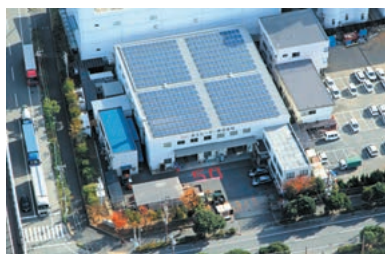
ソーラーパネルも確認できる 井上ヒーター 50 周年記念の 航空写真