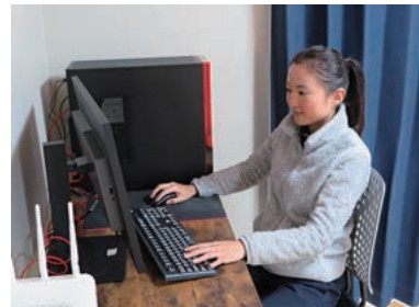
リモートワークによる業務風景