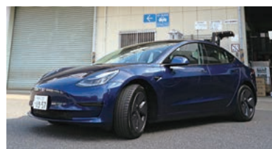
社用車として採用している 電気自動車「テスラ3」