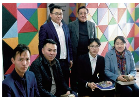
モンゴルの工業高校との国際交流